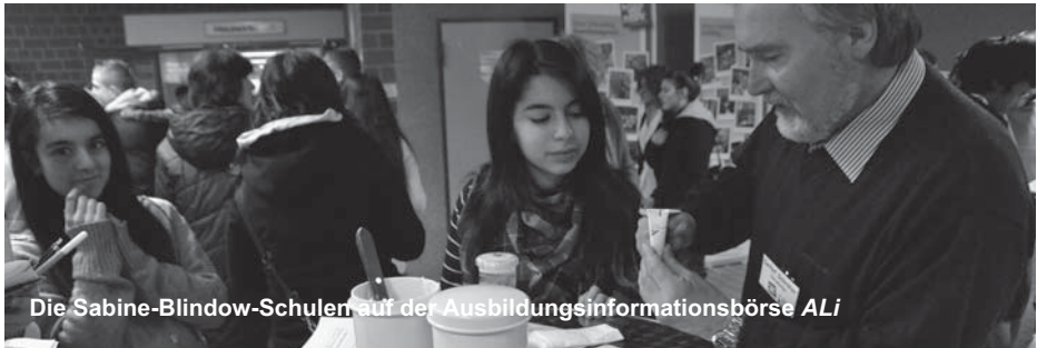
Die Sabine-Blindow-Schulen auf der Ausbildungsinformationsbörse ALI

Physiotherapiepraxis Kirsch Heisterbergallee 83 30453 Hannover T.: 482119