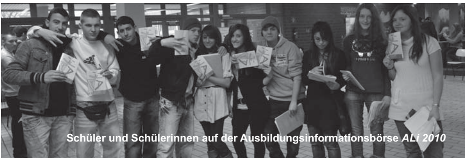
Schüler und Schülerinnen auf der Ausbildungsinformationsbörse ALi 2010

In diesem Beruf passt du elektronische Feingeräte bei Hörgeschädigten an. Du fertigst das Ohrpassstück an, reparierst und wartest die Hörgeräte. Du berätst und betreust die Kunden. (Dies sind nur erste Anhaltspunkte zu dem Beruf, informiere dich genauer.)