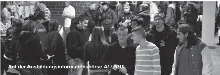
Auf der Ausbildungsinformationsbörse ALi 2010

Unter www.tischler.de erhältst du ausführliche Informationen über das Berufsbild des Tischlers / der Tischlerin. www.tischlernord.de ist der Internetauftritt vom Landesinnungsverband der Tischler & Tischlerinnen in Niedersachsen/Bremen. Über die Eingabe von Postleitzahl und Ort kannst du dir Tischleradressen in deiner Nähe, bzw. in Hannover auflisten lassen. Du kannst bei diesen Betrieben nach Ausbildungsmöglichkeiten fragen.