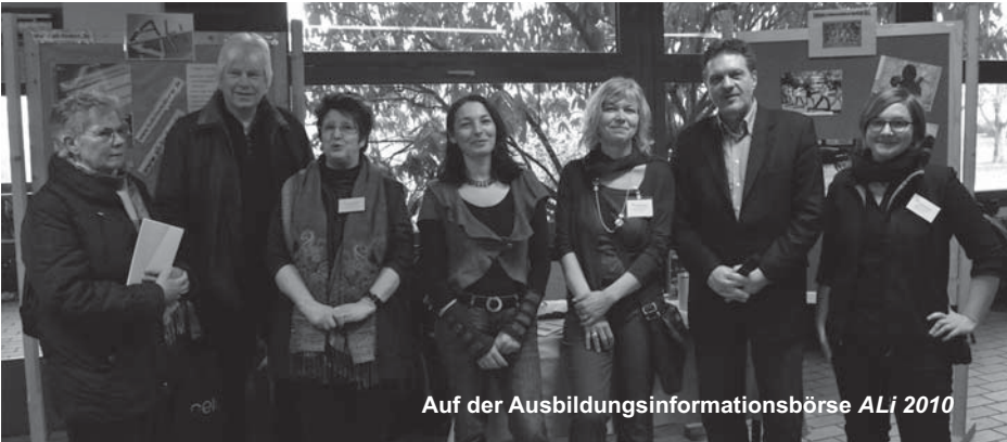
Auf der Ausbildungsinformationsbörse ALi 2010

In diesem Beruf informierst du Kunden über die Serviceangebote deines Unternehmens und verkaufst Dienstleistungen. Du nimmst an Schaltern Sendungen an, berechnest Tarife, erläuterst Frachtberechnungsvorschriften und verkaufst Briefmarken und/oder Verpackungsmaterial. Der Kundenkontakt und die Wünsche der Kunden sind ein wichtiger Bestandteil der Arbeit, doch auch kaufmännische Tätigkeiten wie Schriftverkehr, Buchungen und Abrechnungen sowie Reklamationen und Schadensregulierungen werden von dir bearbeitet. (Dies sind nur erste Anhaltspunkte zu dem Beruf, bitte informiere dich genauer, z.B. bei der Agentur für Arbeit!)