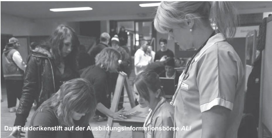
Das Friederikenstift auf der Ausbildungsinformationsbörse ALI

In diesem Beruf berätst und betreust du werdende Mütter. Du führst Vorsorgeuntersuchungen durch und bietest Kurse zur Geburtsvorbereitung an. Du führst Entbindungen durch und bist auch für die Nachsorge da. (Dies sind nur erste Anhaltspunkte zu dem Beruf.)