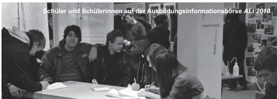
Schüler und Schülerinnen auf der Ausbildungsinformationsbörse ALi 2010

In diesem Beruf verkaufst du unterschiedlichste Konsumgüter, führst Verkaufsgespräche, berätst Kunden und zeichnest die Ware aus. Du sorgst für die fachgerechte Lagerung und Präsentation der Ware. (Dies sind nur erste Anhaltspunkte, informiere dich genauer!)