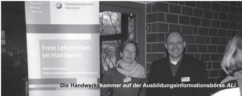
Die Handwerkskammer auf der Ausbildungsinformationsbörse ALI