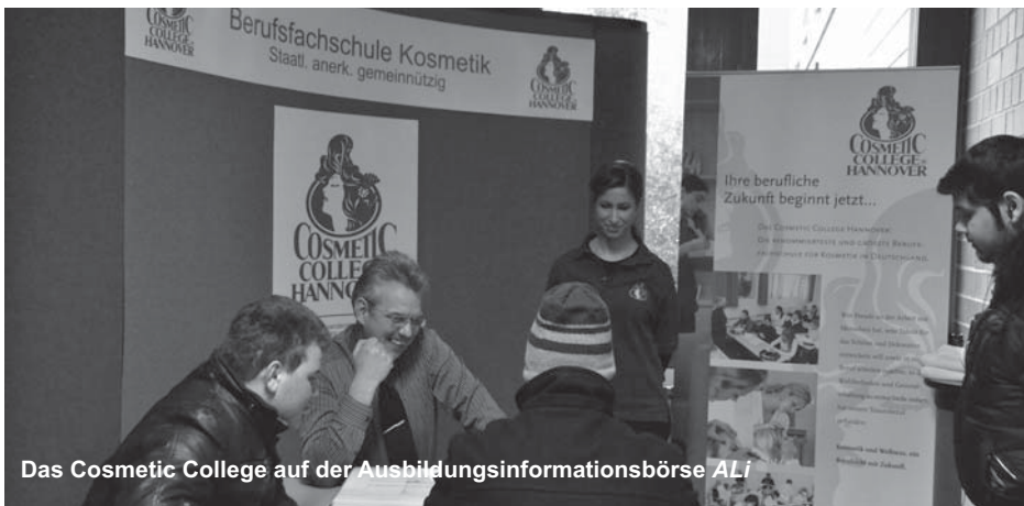
Das Cosmetic College auf der Ausbildungsinformationsbörse ALI

Region Hannover Abteilung für Ausbildungsförderung Hildesheimer Str. 20 30159 Hannover T.: 0511 616-22252 E-Mail: bafoeg@region-hannover.de