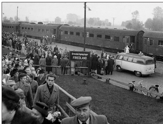
Das Grenzdurchgangslager Friedland 1958